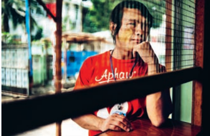
När Min Min smittades med hiv för 19 år sedan hade hon aldrig hört talas om hiv.